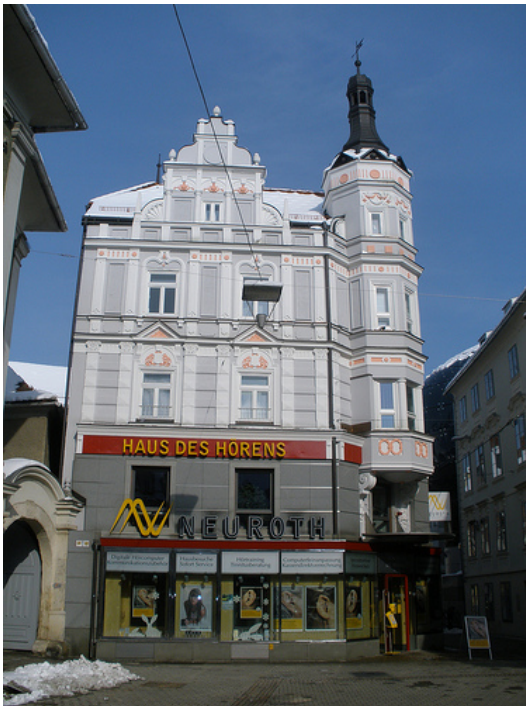
Haus Mariahilferstr. 3 im Jahr 2015